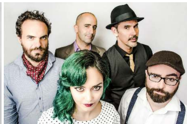
Descargar en alta calidad