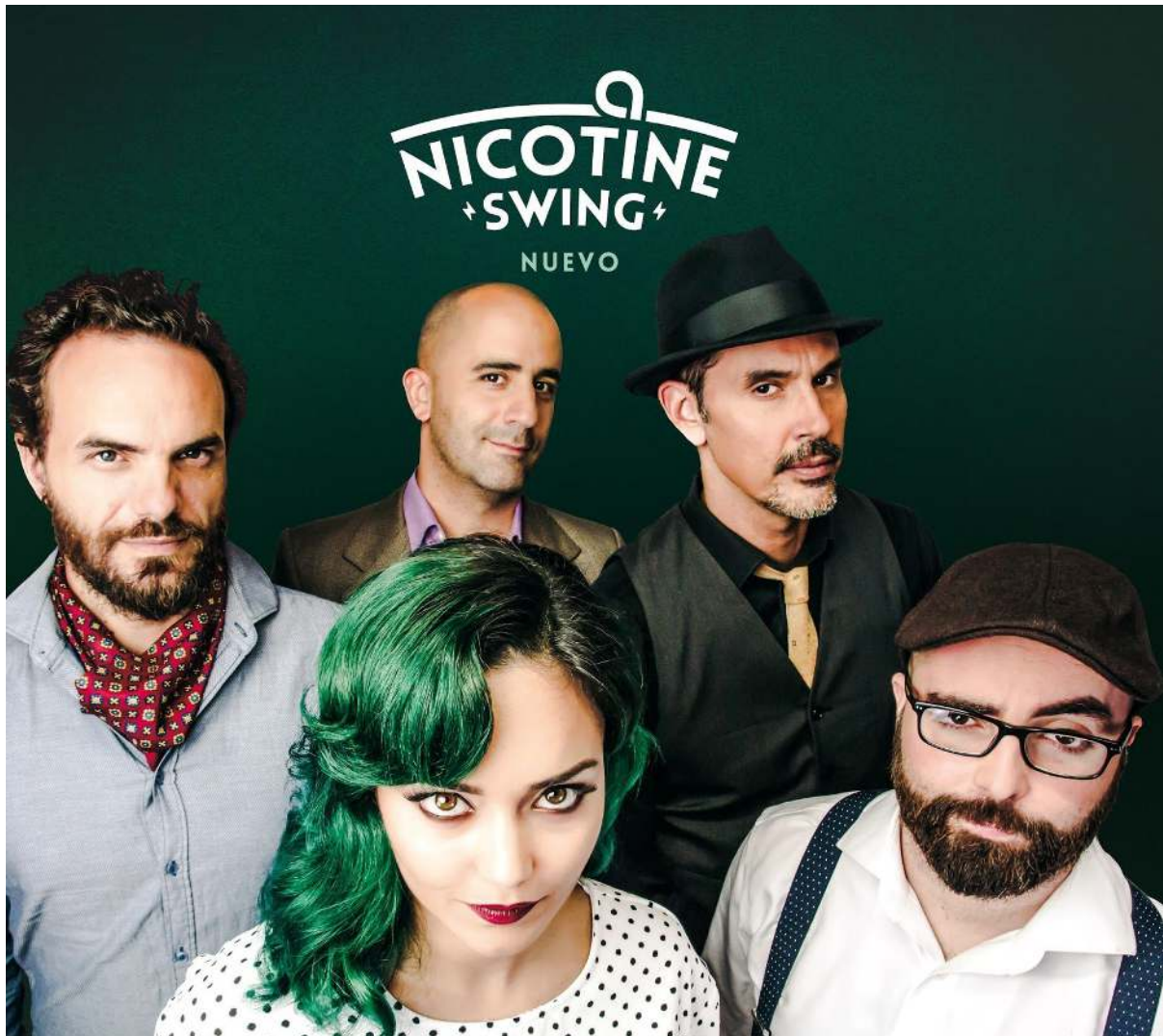
Portada de "Nuevo" de Nicotine Swing. Diseño: Cecilia Erlich