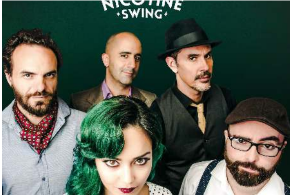
Descargar en alta calidad