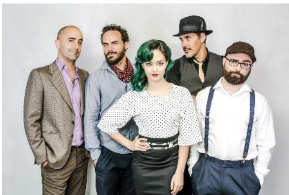
Descargar en alta calidad