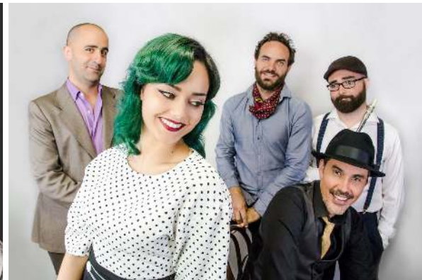
Descargar en alta calidad