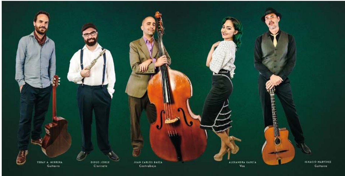
Diseño: Cecilia Erlich Descargar en alta calidad