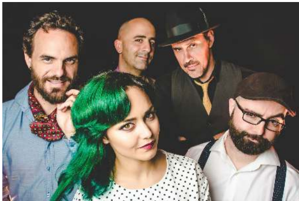
Descargar en alta calidad