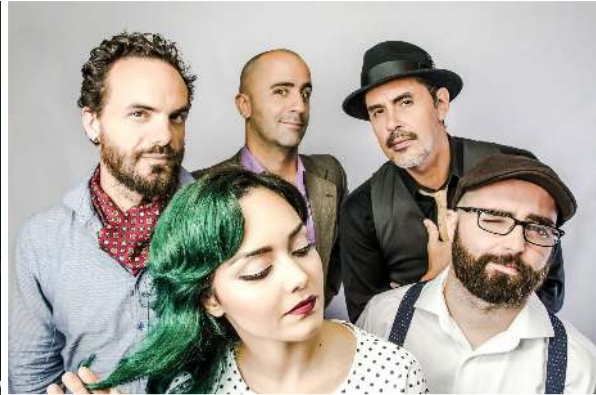
Descargar en alta calidad